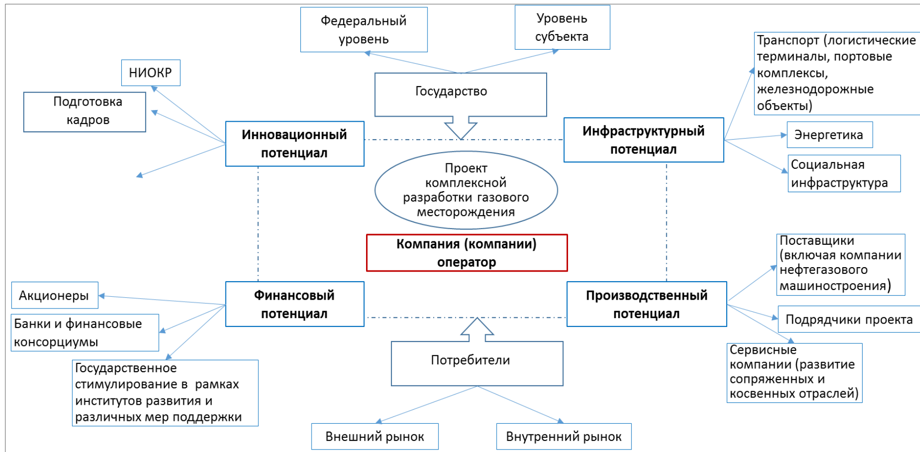
Рис. 2. Концептуальная схема газодобывающего промышленного комплекса в условиях морской части Арктики