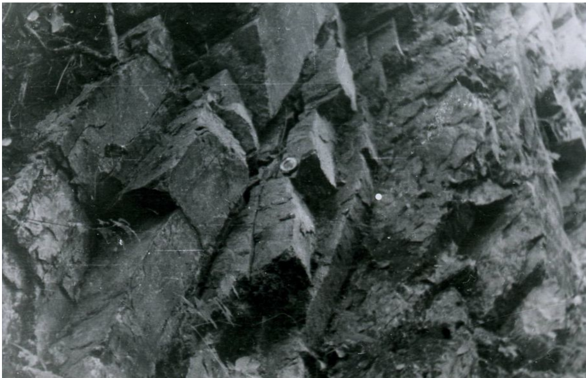
Фото 2. Северо-Кавказская НГП. Трещиноватость поздне меловых тонкозернистых известняков в обнажениях