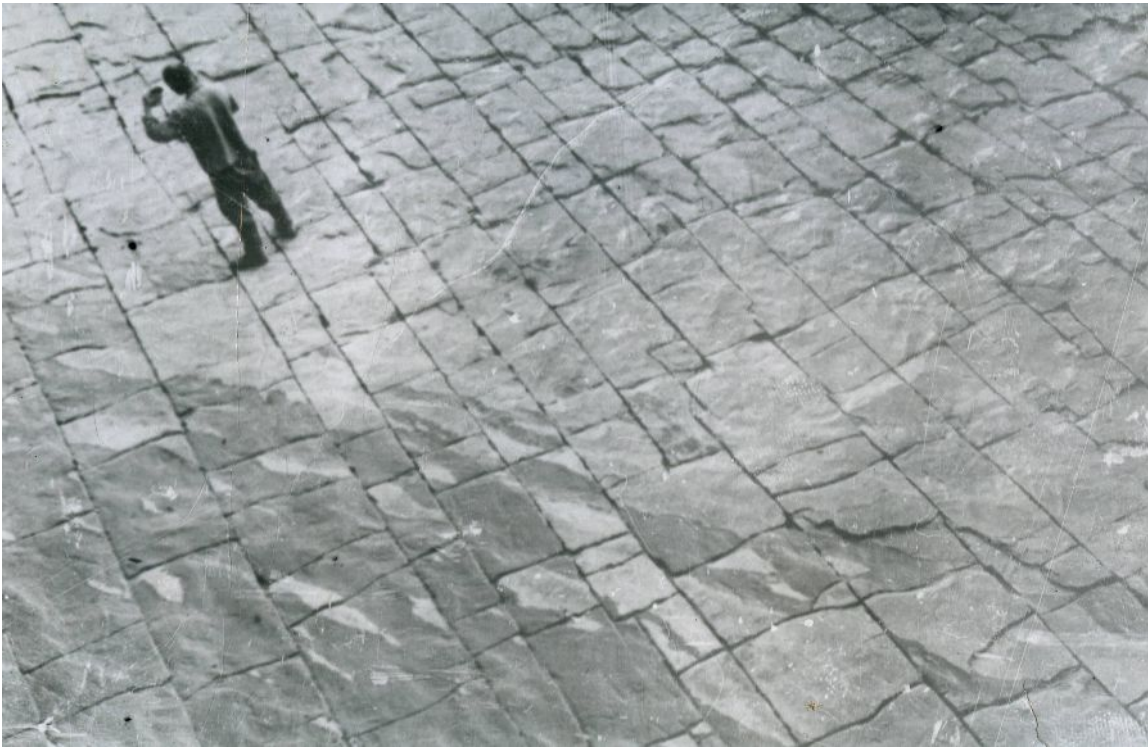
Фото 1. Северо-Кавказская НГП. Трещиноватость поздне меловых тонкозернистых известняков в обнажениях

плотных, сильно трещиноватых известняков верхнего мела, до этого считавшихся бесперспективными для поисков (фото 1 - 3).