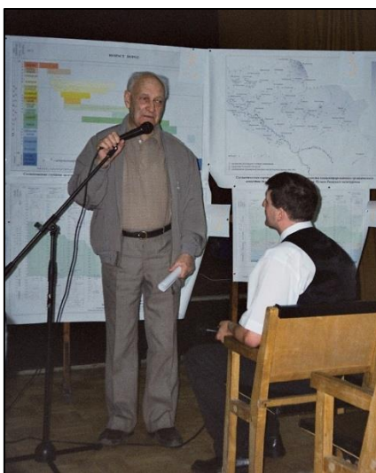
Рис. 2. Фото Ф.Г. Гулари

Сибирскую региональную межведомственную стратиграфическую комиссию (СибРМСК), став ее Почетным председателем с 2004 г. Его глубокие знания и авторитет признаны и в международном сообществе – он стал Почетным членом кембрийской комиссии МСК. Творческий багаж Фабиана Григорьевича Гулари поражает своим объемом и значимостью: он автор и соавтор 229 публикаций, включая 17 монографий (3 из которых – персональные) (рис. 2). Особо выделяются три его монографии общесоюзного и российского значения, вошедшие в серии «Геология СССР» (том XV, «Якутия») и «Геология России» (том II, «Западная Сибирь»).